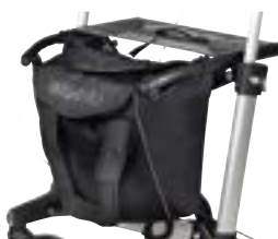
// 7104007 (1) Koszyk/torba, czarna/czarna