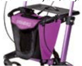
// 7104023 (1) Koszyk/torba, zzaawansowana, zamykana na suwak i z uchwytami, różowa/

Łatwa personalizacja dzięki 7 kolorom ramy.