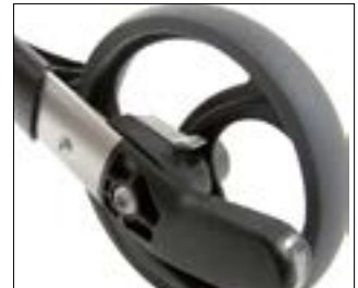
// 7109080 Hamulec spowalniający