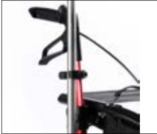
// 7109011 Uchwyt na kule