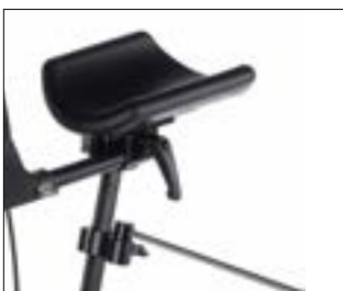
// 9011988 Drażek stabilizujący