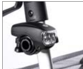
// 7109095 Oświetlenie