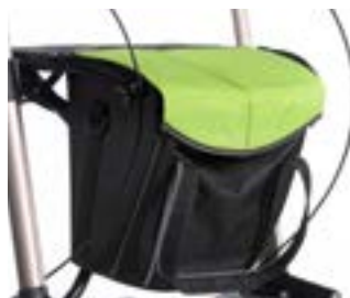
// 9012320 (1) Koszyk/torba, zaawansowana, zielona/czarna