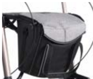
// 9012316 (1) Koszyk/torba, zaawansowana, szara/czarna