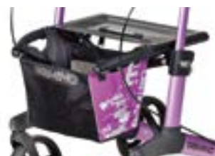
// 7104033 Koszyk/torba, różowy/czarna nadruk