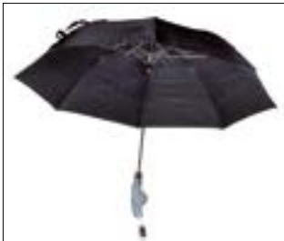
// 7109060 Parasolka, Czarna