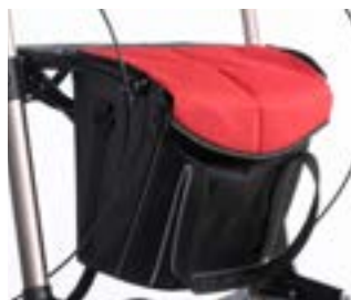
// 9012318 (1) Koszyk/torba, zaawansowana, czerwona/czarna