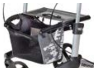
// 7104035 Koszyk/torba, szara/czarna na- druk