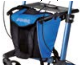
// 7104022 (1) Koszyk/torba, zaa- wansowana, zamykana na su- wak i z uchwytami, niebieska/