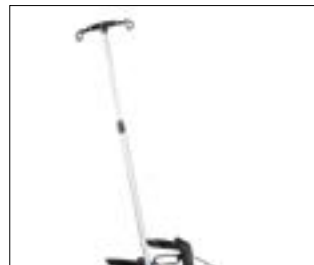
// 7109100 Stojak na kroplówkę