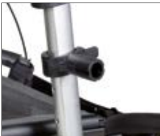
// 7109090 Uchwyt uniwersalny