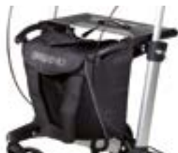
// 7104006 (1) Koszyk/torba, zzaawansowana, zamykana na suwak i z uchwytami, czarna/