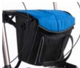
// 9012319 (1) Koszyk/torba, zaawansowana, niebieska/czarna