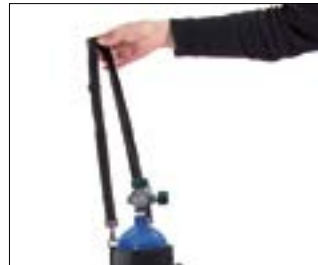
// 7109050 & 7109051 Koszyk na butlę tlenową