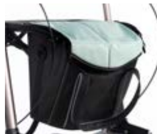
// 9012317 (1) Koszyk/torba, zaawansowana, miętowa/czarna