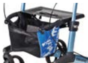
// 7104032 Koszyk/torba, niebieski/czarna nadruk