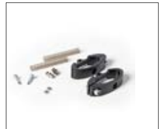
// 9011971 Hamulec odwrócony, zestaw