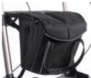
// 9012314 (1) Koszyk/torba, zaawansowana, czarna/czarna