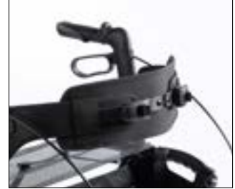
// 9012222 (3) Regulowany, komfortowy, pas stabilizujący lędźwiowo- krzyżowy