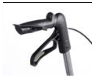
// 9012281 (4) Dłuższe rączki do prowadzenia, zestaw

(2) Niedostępne dla Gemino 60/60 M & Gemino 60/60 M Walker.