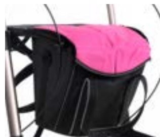
// 9012321 (1) Koszyk/torba, zaawansowana, różowa/czarna