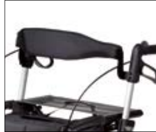
// 9012220 & 9012221 (2) (3) Pas stabilizujący lędźwiowo- krzyżowy