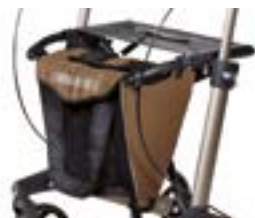
// 7104024 (1) Koszyk/torba, zaa- wansowana, zamykana na su- wak i z uchwytami, brązowa/