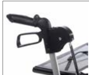
// 9012063 (2) Hamulec jednoręczny