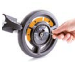
// 9009329 Speedcontrol