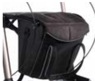
// 9012315 (1) Koszyk/torba, zaawansowana, alcantara/czarny