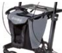
// 7104025 (1) Koszyk/torba, zzaawansowana, zamykana na suwak i z uchwytami, szary/