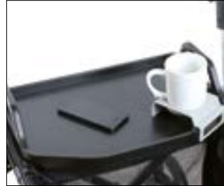
// 7109140 Stolik