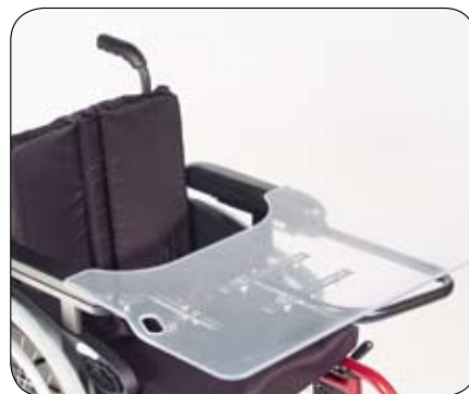
Dostępne opcje dla stolika Nasuwany i odchylany (na zdjęciu, opcja)