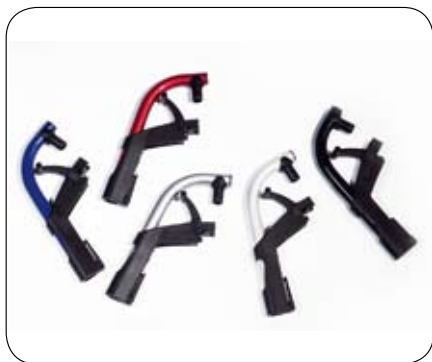
Wybór z pięciu kolorów