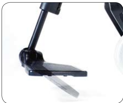
Podnóżek ma regulację kąta (+/- 15°), głębokości i wysokości (standard)