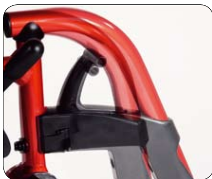
Dwie opcje dla wieszaka (70°/80°), aby sprostać wymaganiom klienta (położenie nóg, długość wózka)