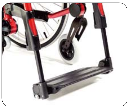
Jednoelementowy, odchylany, aktywny podnóżek usztywniający i zapewniający łatwy transfer (opcja)