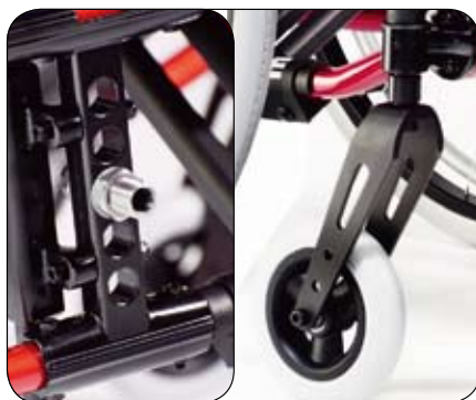
Siedzisko z regulacją wysokości i pochylenia kół tylnych za pomocą płyty tylnej półosi, obudowy kółka przedniego i widelca (standard)