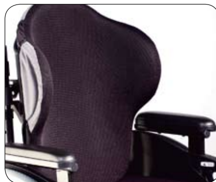
Szeroki zakres oparć Jay J3 i pełny zakres poduszek Jay (opcja) w celu zapewnienia optymalnych aktywnych parametrów ergonomicznych i ułożenia