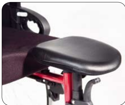
Wspornik dla amputantów (opcja)