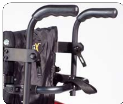
Uchwyty do popychania typu offset o regulowanej wysokości (opcja)